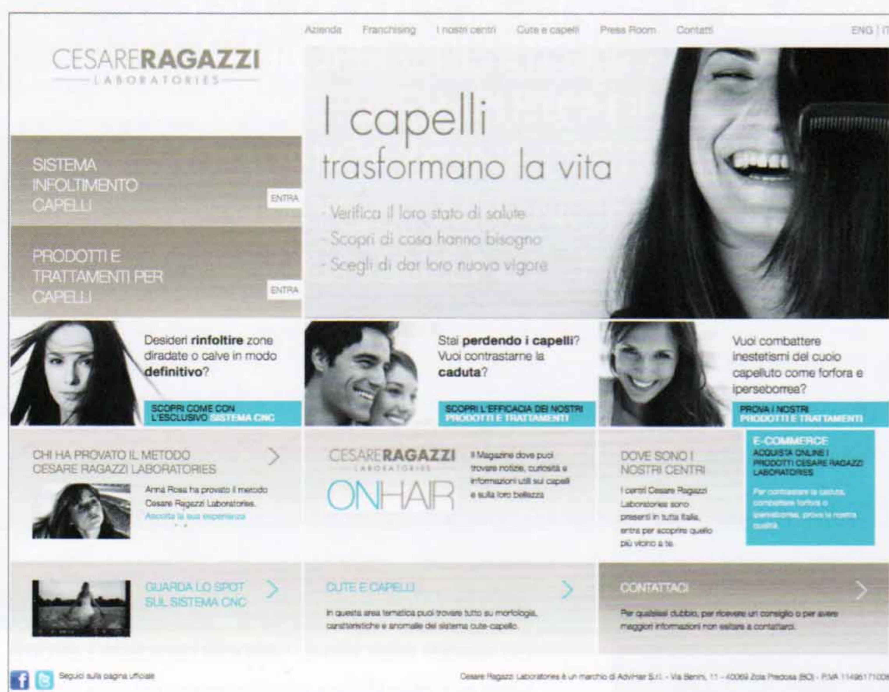
ALCUNI DEI SITI REALIZZATI DA LAYOUTWEB PER I CLIENTI TOY G (SOPRA), CESARE RAGAZZI (A SINISTRA) E RODO FIRENZE (A DESTRA). IN BASSO, L'HOME PAGE DEL SITO DELL'AGENZIA IN LINGUA CINESE.

permetta loro di farsi conoscere e farsi trovare sul web, creando una forte connessione con una realtà economica sempre più importante. Oggi è infatti molto difficile trovare le aziende italiane nei risultati di ricerca in lingua straniera: si ottengono buoni risultati rimanendo dentro i confini nazionali, ma non appena li si varca, gli esiti sono scarsi e talvolta inesistenti. Non è sufficiente infatti realizzare siti in varie lingue, ma occorre lavorare sui server paese per paese. Layoutweb lo sa, ed è per questo che con la Cina sta facendo esattamente ciò che ha già fatto con altre realtà più vicine: per garantire la visibilità dei clienti, l'agenzia dispone di una rete di strutture server dislocate direttamente in loco, prima di tutto per assicurare alle aziende il migliore posizionamento sui motori di ricerca dei vari paesi, e poi – nel caso per esempio della Cina – per evitare una buona parte di problemi dovuti alla censura. La dislocazione territoriale dei server è una sfida in cui Layoutweb crede molto e che probabilmente anche in questo caso farà la differenza nella qualità dei servizi offerti dall'agenzia. MK